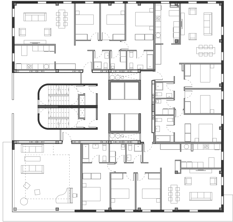
PLANTA TIPO A (baja)